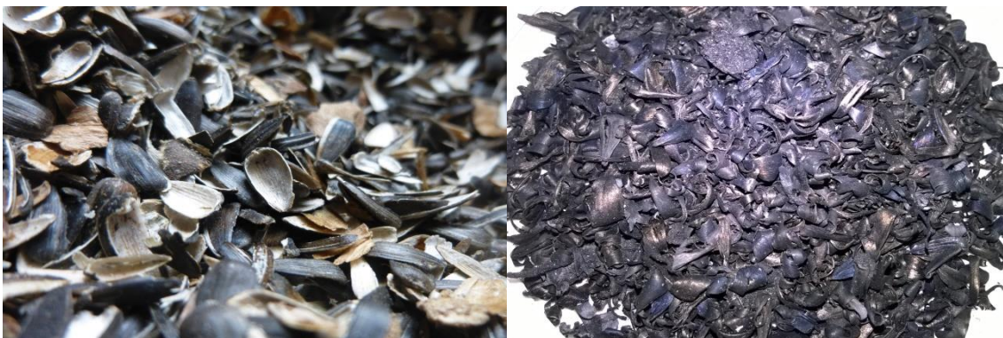
Imagen 2: CSG original (izquierda) y CSG tratadas a 550°C (derecha)